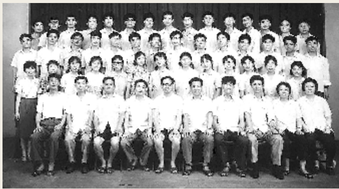
786abcd <1981-07[efghi ! " =

4 个 a : - b 7 8 6 g 5 c C D - g 8 ~ 学 c $ O 学 y 化学系 上 b + 5 - g 4 2 ' ~ 学 m $ R y u c 大 3 4 $ t 1 6 $ 大 t 相 1 8 $ A 两 人 D ~ g - & , - : g 1 - $ . O 学 1 学 d 学生 u > 到 g 8 4 严森林 Q Q 谈 E Q Q Q } Q