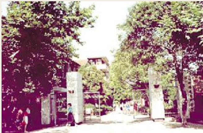
23FGHI JKLMNO <PQ81289=>

8 10! " # $ % & ' ) i c q $ 1 _ ($ ) * + , - . / 0 1 2 3 4 5 6 7 8 9 : ; < = > 6 - ? @ $ A B C C D 5 E F G H I J K L 5 M N - O P Q R S T $ U V " W X Y 5 Z [ \ . ] ^ _ ` - a Y b 4 0 c d e f 5 7 8 6 g h i 6 j k l m n K Y U o p . $ q r s 2 t u T v w x y z . { | A e f 4 0 } c ~ 学 ; D 事宜 - 放下 U V T $ . 马上做 J 两件事 : - b o p 湖州师范学院 y 友联络办公室和生命科学学院相关领导安排 R 洽 ; 二 b U V 联系并亲自驱车去长兴雒城 R 老 g 长严森林 Y 湖共 | - " # $ . 们具体 | 量 J 举办 ~ 学 ; 5 相关事宜 - 一番叙谈和交流 $ 勾起 J . 对 4 0 c d 与 7 8 6 g 5 ~ 学们一起学习 5 美好 u 光 5 回忆 -